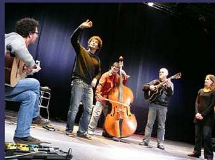
SALE PETIT BONHOMME